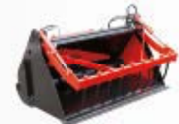
Pala desilatrice e distributrice