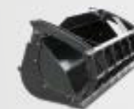
Pala con griffa

La produttività e la sicurezza dipendono dalle attrezzature che devono essere adatte per le prestazioni del vostro sollevatore. Quando sviluppiamo le nostre macchine, individuiamo le attrezzature in grado di garantirvi un'ottima resa e il rispetto delle norme in vigore. Manitou vi accompagna in tutte le vostre applicazioni.