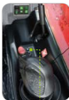
Selezione modo operativo specifico (versione H, Idrostatico) o selezione marce (versione PS, Powershift).

Basta una semplice pressione con un dito sui pulsanti + / - del JSM® per selezionare i vari rapporti.