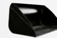
Pala per cereali