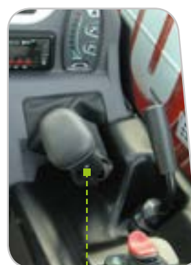
Innesto marce (versione Powershuttle).