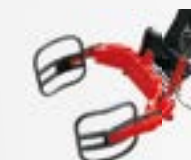
Pinza balle fasciate