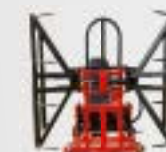
Pinza balle con griffe